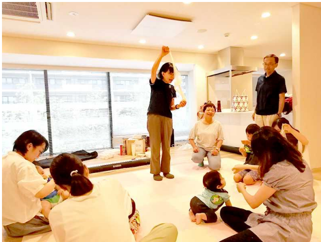
「おひさまリトミック」

が苦手”って変だと思いませんか？実はこういった意識は学校の音楽の授業で植え付けられてしまうケースが多いんです。僕はそれを転換していきたい。